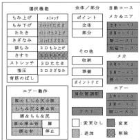
図4：動作モードの追加・変更

図4に健康機器の旧型から新型へのモデルチェンジを行った場合の動作モードの追加・変更・削除を一覧にしたものを示した。モデルチェンジ品の開発は、ZIPC上で複数の動作モードを追加変更し、遷移先の変更、アクションやアクティビティの変更を行い、C言語のソースコードを生成することによって行った。これにより、多くの部分を再利用できるとともに、変更もZIPC上で簡単に行うことができた。