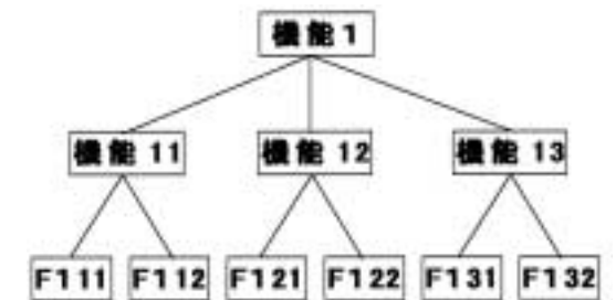
図2：機能分割によるプログラム構成

これに対して、制御系ソフトウェアのアプリケーション層は、システムの振る舞いを実現する部分であるため、システムの動作モード単位に処理を分割することになる。