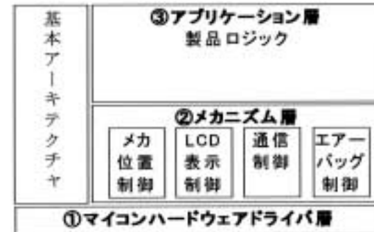
図1：フレームワーク構成図

ェア部分の修正がなく、メカニズム層の制御対象ハードウェアに対応する部分のみを交換すればよい。