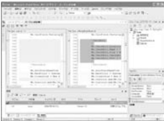
図4 Microsoft Visual Studio.Netとの連携

Version Managerは、ファイルとそのバージョンを一元管理することが可能です。専用のデスクトップクライアントやVisual Studio（図4）上、Webクライアント、コマンドラインなどからファイルを操作することができます。