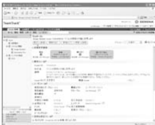
図1 TeamTrackを使用した案件管理