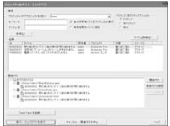
図5 Version ManagerとTeamTrackの連携

また、Version ManagerはTeamTrackと関連付けを行うことで、連携させることが可能です。これにより、Visual Studio上からのソースコードの変更と開発案件と関連付けて操作することができます。（図5）